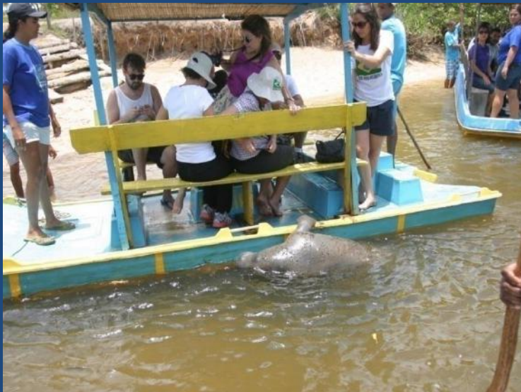
(Passeio para observação de peixe-boi)

Porto de Pedras (AL) - passeio para observação do peixe-boi marinho, animal ameaçado de extinção, que é reintegrado ao ambiente natural através do Projeto Peixe Boi.