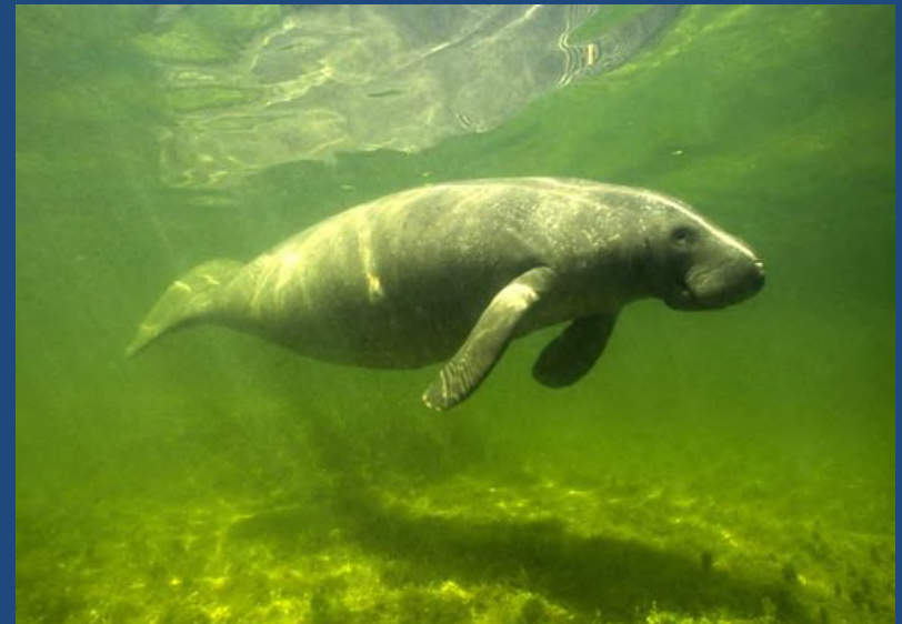
(Peixe-boi marinho)